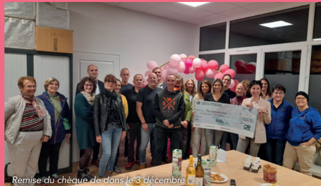
Remise du chèque de dons le 3 décembre

Cette année, la mobilisation autour d'Octobre Rose s'est encore étoffée !