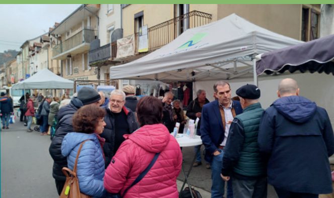
Stand des élus du 29 novembre 2025

De nouveau, les élus ont accueilli de nombreux Capdenacois sur le stand du marché, le samedi 29 novembre. L'occasion pour les habitants de rencontrer leurs représentants et d'échanger sur les sujets qui les concernent directement.