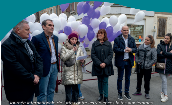
Journée internationale de lutte contre les violences faites aux femmes