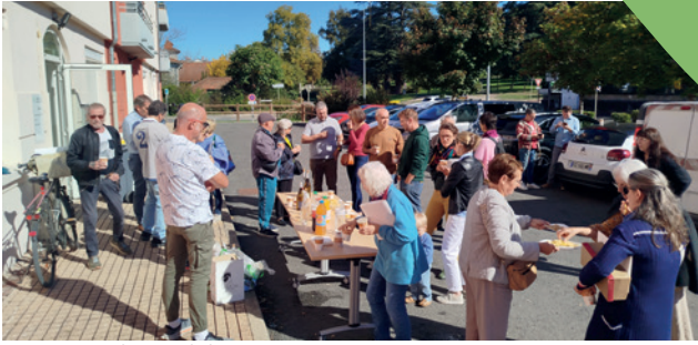
Cérémonie d'accueil des nouveaux arrivants