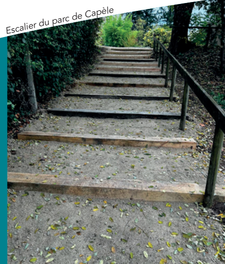
Escalier du parc de Capèle

Conformément à la réglementation, deux panneaux d'affichage libre vont être implantés : un premier panneau est déjà en place à l'entrée de la ville à Saint-Julien d'Empare, le second panneau sera situé au niveau du parking de la locomotive.