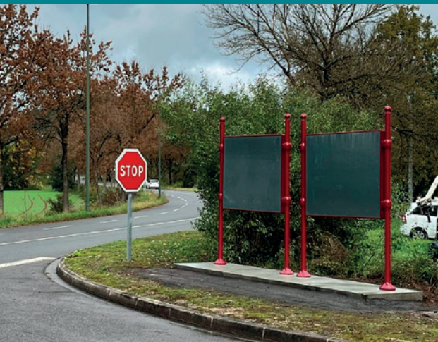
Mise en place des panneaux d'affichage

Conformément à la réglementation, deux panneaux d'affichage libre vont être implantés : un premier panneau est déjà en place à l'entrée de la ville à Saint-Julien d'Empare, le second panneau sera situé au niveau du parking de la locomotive.