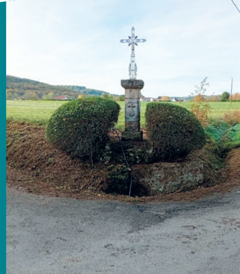
Nettoyage de la Croix de Livinhac