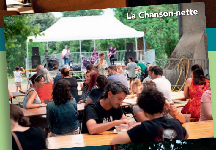
Les Rencontres Musicales