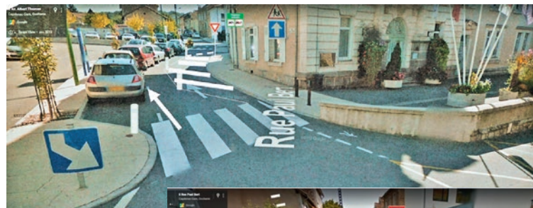
Rue Paul Bert : entrée école Pierre Riols

La Commune va engager cet été des travaux d'aménagement de sécurité aux abords des écoles Pierre Riols, Beau Soleil ainsi qu'au collège Voltaire. Ces travaux ont pour objectif d'améliorer la sécurité des enfants et des parents qui circulent aux abords des établissements scolaires.