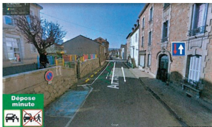
Avenue Albert Thomas : entrée école Pierre Riols

La Commune va engager cet été des travaux d'aménagement de sécurité aux abords des écoles Pierre Riols, Beau Soleil ainsi qu'au collège Voltaire. Ces travaux ont pour objectif d'améliorer la sécurité des enfants et des parents qui circulent aux abords des établissements scolaires.