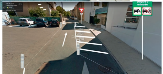
Rue Paul Bert : entrée collège Voltaire

Pour l'école Pierre Riols, les deux entrées de l'établissement seront pérennisées. Aussi, le secteur de la rue Paul Bert fera l'objet d'aménagements qui viseront à créer trois places « dépose minute » avec le déplacement de la voie de circulation. Ces trois places en dehors des horaires de dépose des élèves seront affectées à la zone bleue.