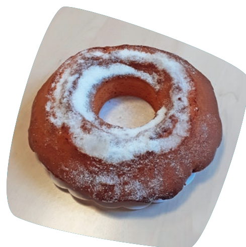
Fouace de Capdenac-Gare

Le second parcours « Gastronomie et Terroir » permettra de découvrir les produits locaux mis en valeur par les commerçants et les restaurateurs capdenacois. Tout en flânant, vous pourrez découvrir des produits locaux divers qui participent à la richesse de notre patrimoine.