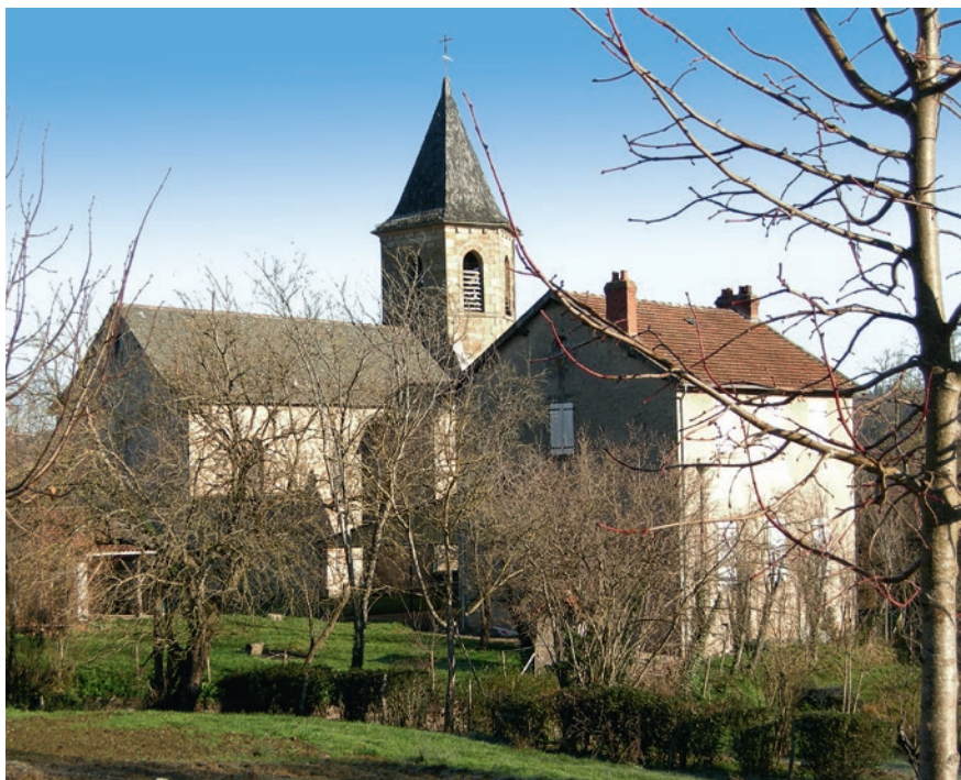
Église de Livinhac

L'église de Livinhac est vraisemblablement d'origine romane comme l'atteste ses chapiteaux polychromes. Au XVIII ème siècle, une campagne de travaux de rénovation a été réalisée pour lui conférer l'architecture que l'on connaît aujourd'hui. Cet édifice n'est ni classé, ni inscrit aux monuments historiques. Il s'avère qu'aujourd'hui la toiture présente de nombreuses faiblesses engendrant des voies d'eau qui commencent à affecter la charpente. De plus, l'absence de cheneaux et gouttières porte