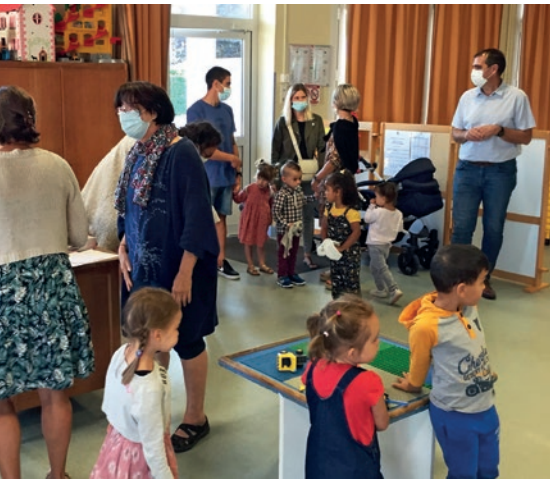
Rentrée scolaire à l'école Beausoleil (2021)

La Commune assume toutes les charges de fonctionnement des écoles publiques :