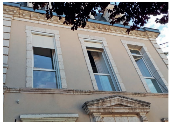
Stores école Pierre Riols