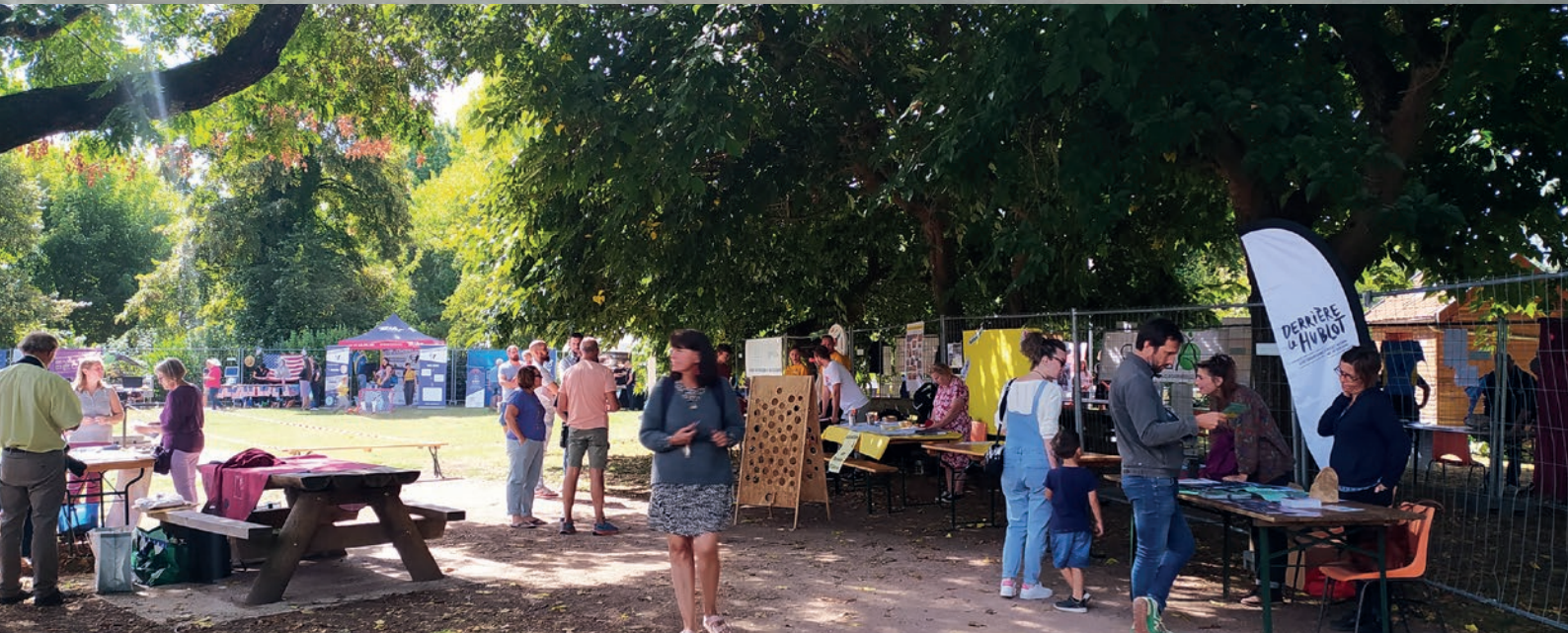
Forum des associations, samedi 10 septembre