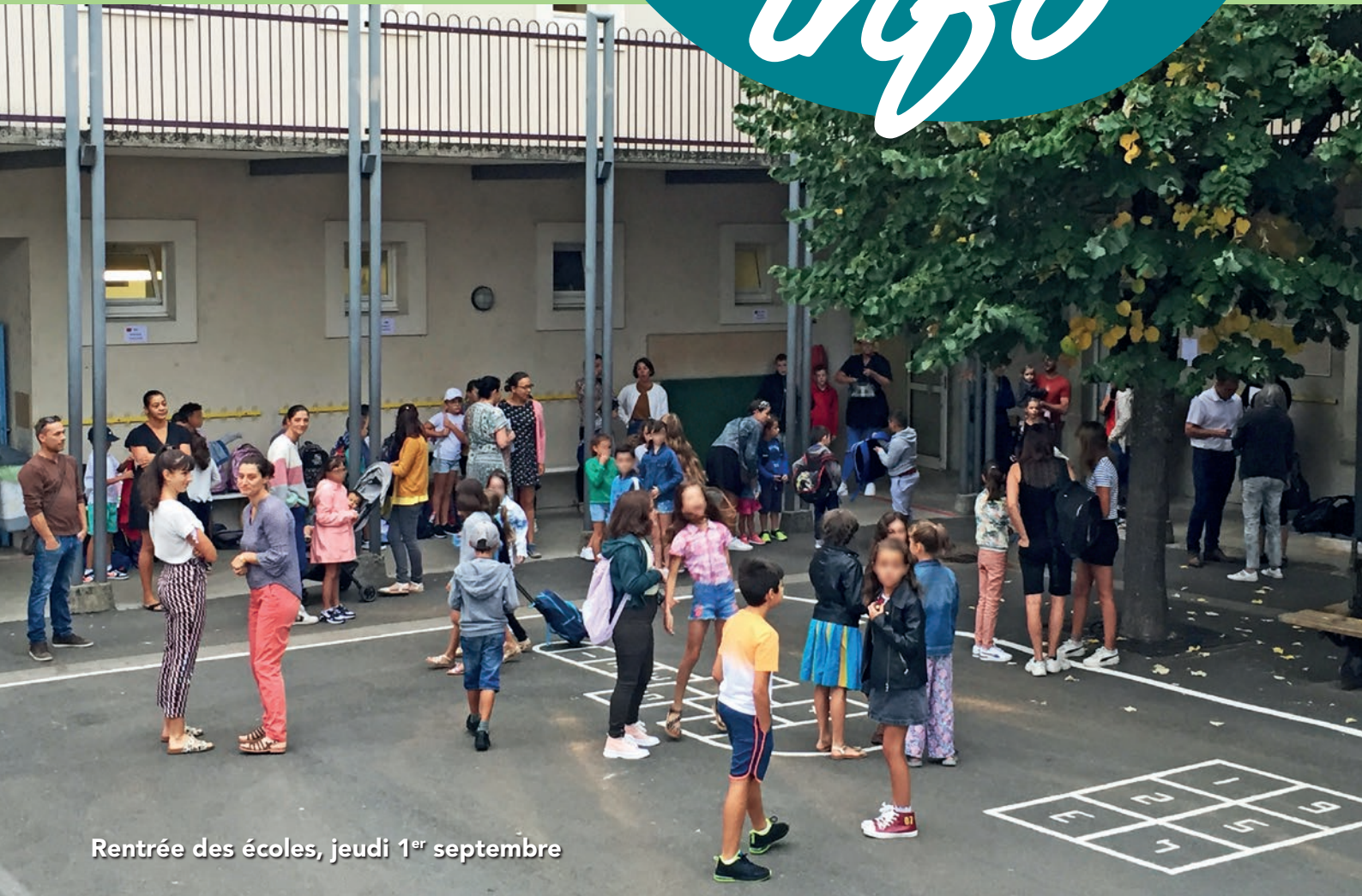
Rentrée des écoles, jeudi 1 er septembre