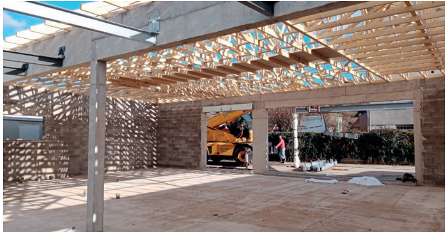
L'Accueil Passerelle en construction.

● Second projet d'envergure : la construction d'un Accueil Passerelle pour les enfants de 2 ans. Mis en place dès 2020 à l'école Chantefable avec le recrutement d'une équipe dédiée, il s'installera de façon définitive sur le site de l'école Beau Soleil, pour une liaison directe avec l'école maternelle, à la rentrée de septembre.